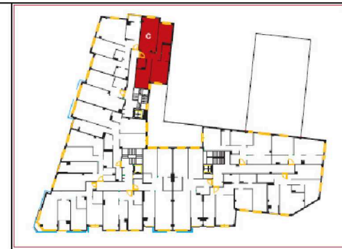
EL BARCO Nº2 - PLANTA TERCERA_TIPO C